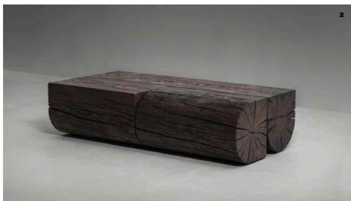
2 Adjacencies Rectangular Table basse en chêne massif, brossé poivre gris. 144 x 72 x H. 37 cm. Design Samuel Barclay. Van Rossum